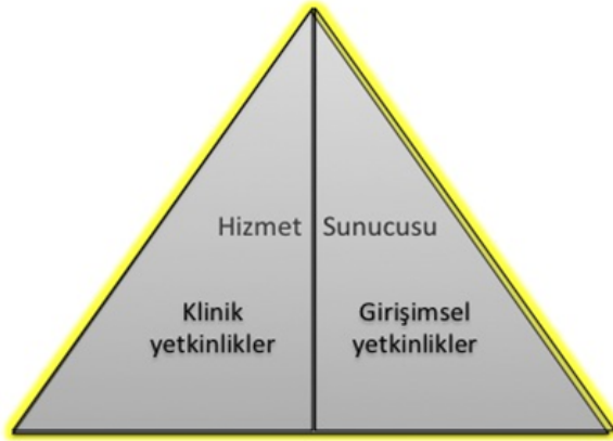
Şekil 2- TUKMOS yedinci temel yetkinlik alanı: Hizmet Sunucusu

Girişimsel Yetkinlik: Bilgiyi, kişisel, sosyal ve/veya metodolojik becerileri tıbbi girişimler konusunda kullanabilme yeteneğidir.